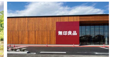
無印良品穂高ショッピングパーク