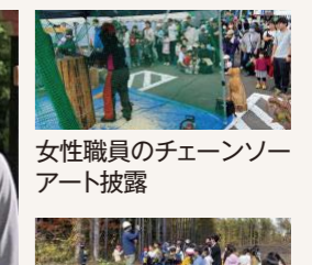
女性職員のチェーンソーアート披露 小学5年生の林業現地学習