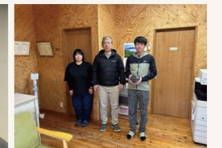
須江社長と事務職員