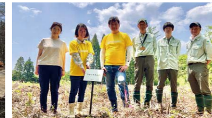
企業による植林活動(マネックス証券)