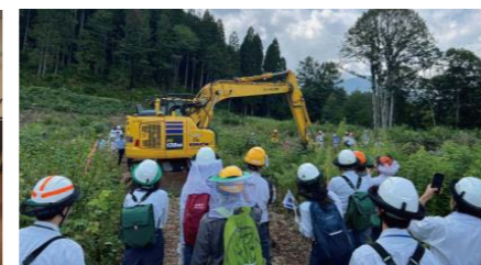
マシンガイダンス機の下刈り実演会

「持続的な組合運営には職員各自の能力発揮が重要。長期的な視点に立って人材育成を進めていきたい」と参事。