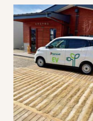
本所の木製駐車場とSDGsにより導入したEV

株式会社小松製作所と連携し、土木・建設業用のマシンガイダンス機を活用して下刈り作業の実証に取り組んでいる。